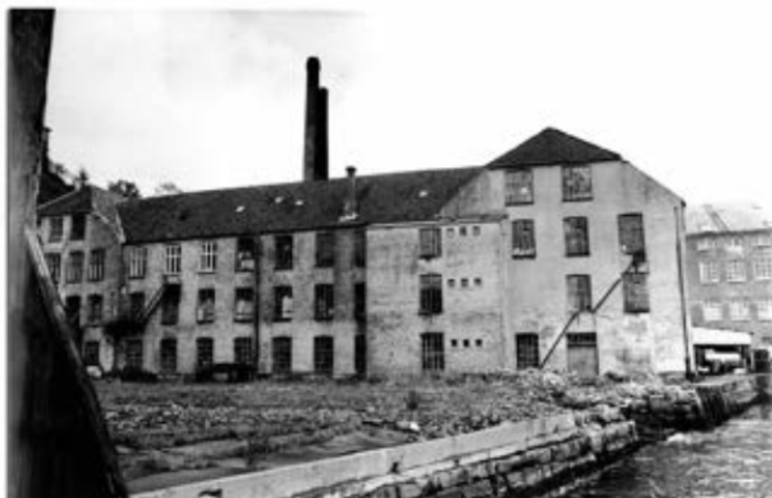
Karen starter USF hotel på å ramle sammen. Tilstanden til bygget og terrenget var ikke på topp på 80-tallet.

Fra treskip, fisk og kriminalitet til kulturhus med landets største artister. USF Verftet fyller 30 år.