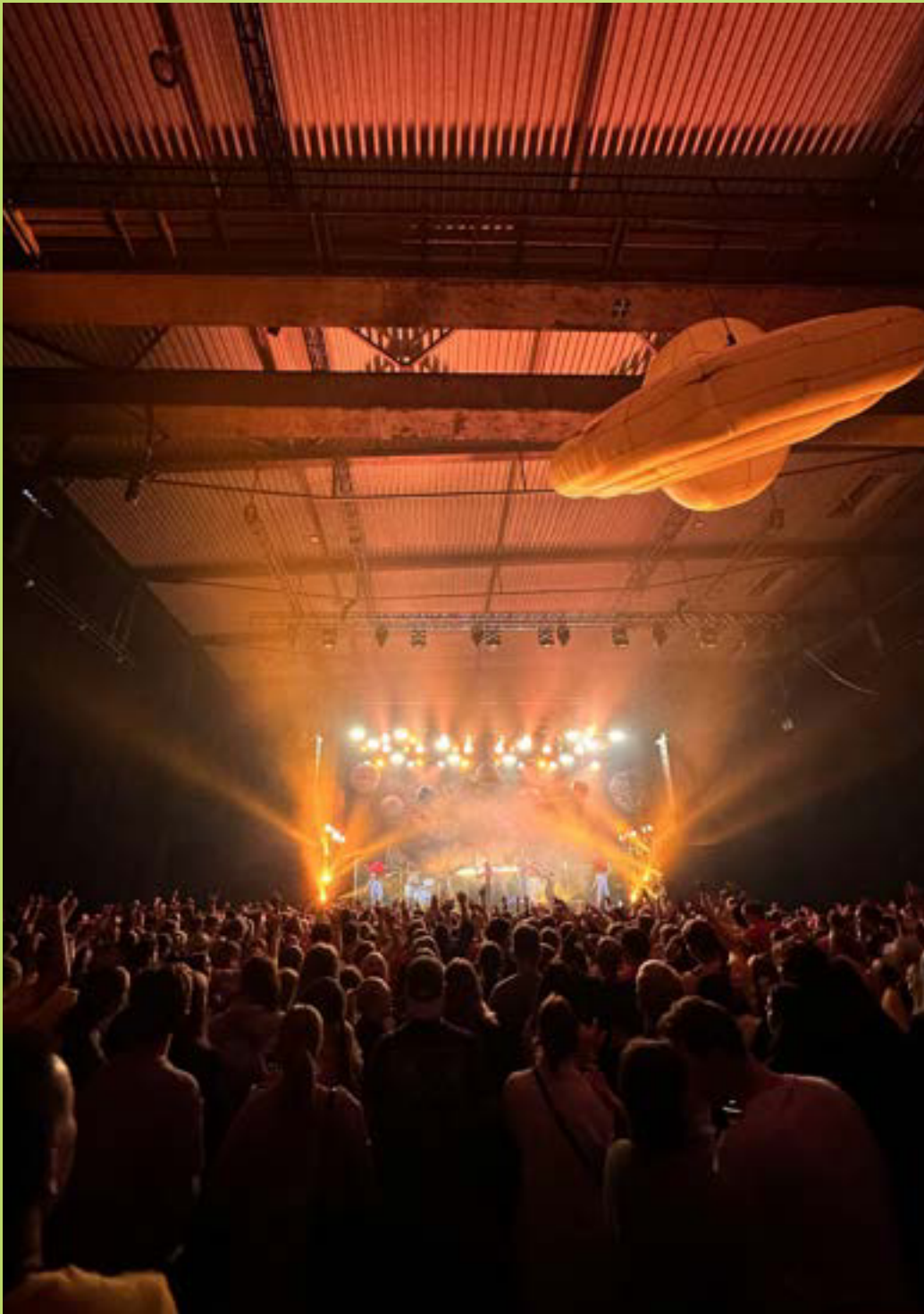
ESC ungdomskompani for samtidsdans med forestillingen BIG BIG BANG av koreograf Jonathan Ibsen.