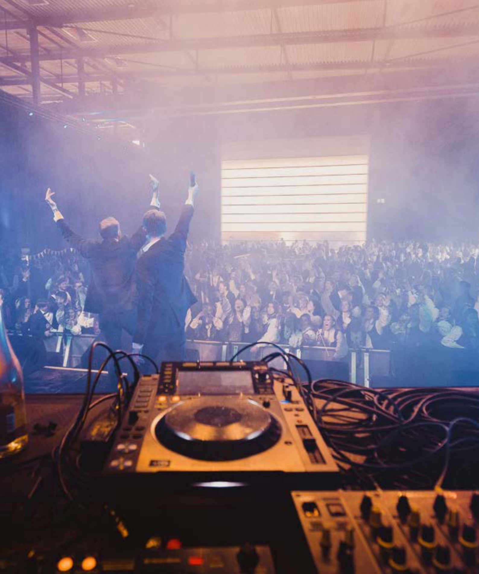
17. mai konsert - Bunadsboogie- i Hallen USF 2023