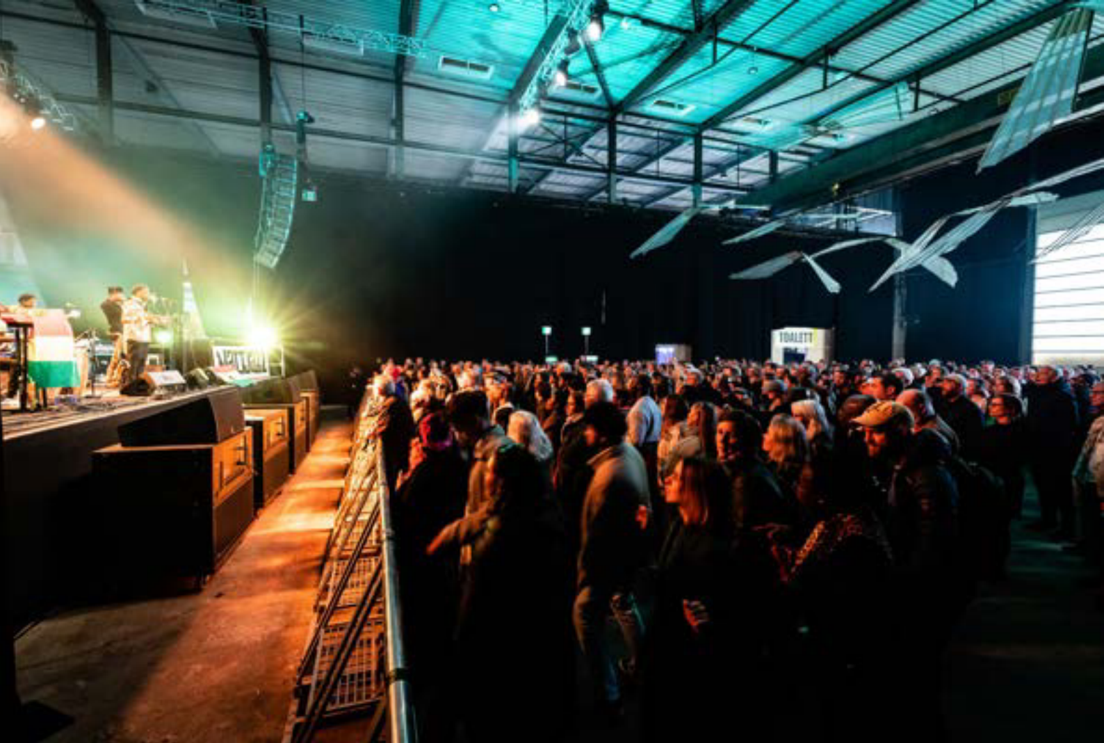
Åpning av Nattjazz i Hallen USF, 2023.